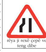
rêya ji rexê çepê ve teng dibe