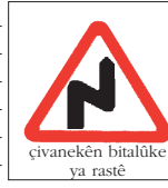
çivanekên bitalûke ya rastê