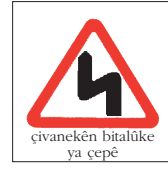
çivanekên bitalûke ya çepê