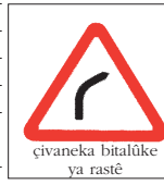
çivaneka bitalûke ya rastê