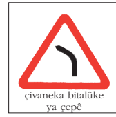
çivaneka bitalûke ya çepê