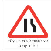
rêya ji rexê rastê ve teng dibe