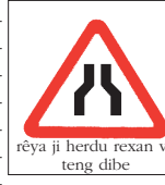
rêya ji herdu rexan ve teng dibe